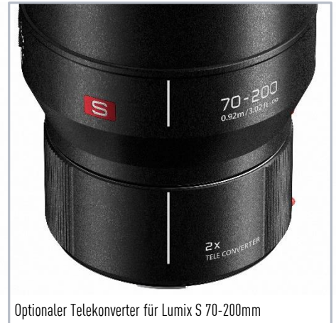
Optionaler Telekonverter für Lumix S 70-200mm