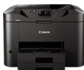
Série MAXIFY MB2750