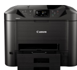
Série MAXIFY MB5450