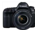
EOS 5D Mark IV