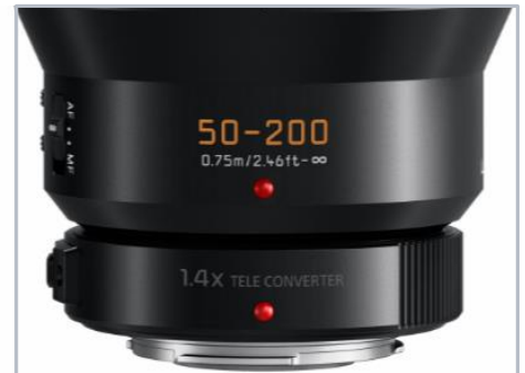
Telekonverter (1,4x und 2,0x) optional

Mit seinem lichtstarken Brennweitenbereich vom 50 bis 200mm bietet dieses Zoom der Leica DG Vario-Elmarit F2,8-4,0-Serie trotz seiner Kompaktheit eine beachtenswerte Möglichkeit entfernte Objekte heran zu holen. Diese kann über optionale Konverter sogar auf bis zu 800mm (KB) erweitert werden. Das von LEICA zertifizierte Objektiv garantiert höchste Auflösung und geringste Verzeichnung durch seine spezielle Linsenstruktur.