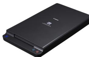
DIN A4-Flachbett-Scaneinheit 102

Scannen Sie Bücher, Zeitschriften und empfindliche Medien mit der optionalen Flachbett-Scaneinheit 102 (bis DIN A4) oder der Flachbett-Scaneinheit 201 (bis DIN A3). Einfach per USB angeschlossen, arbeiten diese Flachbettscanner nahtlos mit dem DR-C225 II (ausschließlich) zusammen und ermöglichen die Anwendung aller verfügbaren Funktionen zur Bildverbesserung.