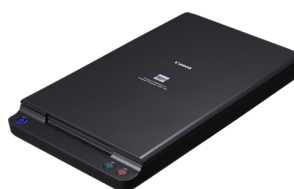
A4 Flatbed Scanner Unit 102

Esegui la scansione di libri rilegati, diari e documenti fragili aggiungendo l'unità scanner a piano fisso 102 per documenti fino al formato A4 oppure l'unità scanner a piano fisso 201 per documenti di formato A3. Collegati tramite USB, questi scanner a piano fisso funzionano perfettamente con il modello DR-C225 II (solo) e consentono di eseguire scansioni fronte-retro senza problemi e di applicare le stesse funzioni di miglioramento delle immagini a qualsiasi scansione.