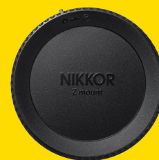
BOUCHON D'OBJECTIF ARRIÈRE LF-N1