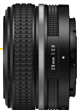
NIKKOR Z 28mm f/2.8 SE