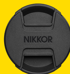
BOUCHON D'OBJECTIF AVANT LC-52B