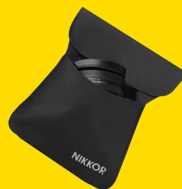
ÉTUI POUR OBJECTIF CL-C4