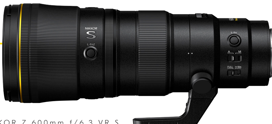
NIKKOR Z 600mm f/6.3 VR S