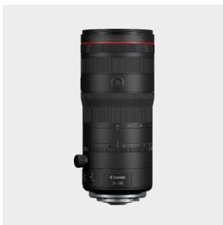
RF 24-105mm F2.8 L IS USM Z