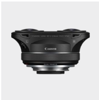
RF-S 3.9mm F3.5 STM DUAL FISHEYE