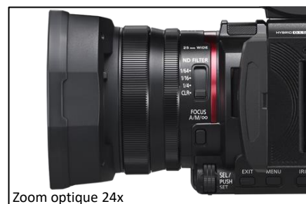
Zoom optique 24x