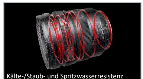
Kälte-/Staub- und Spritzwasserresistenz

S-R1635E | EAN 5025232910274 | UVP: CHF 1'949.-