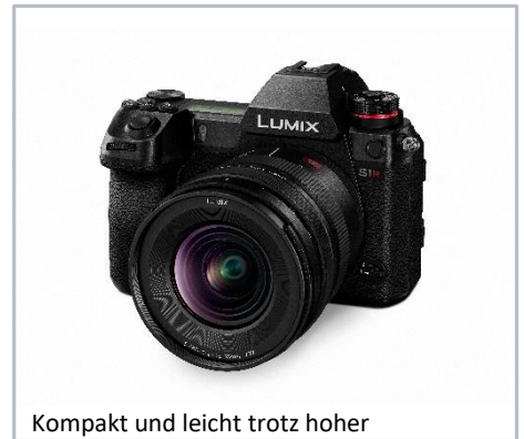
Kompakt und leicht trotz hoher Auflösungsleistung

Vielseitig und hochwertig – hohe Auflösung bis an den Rand und traumhaftes Bokeh Robustheit – Staub-, Spritzwasser- und Kälteresistent Flexible Bedienung - Intuitive Fokus-Clutch Funktion Schneller & präziser Autofokus - Doppeltes Fokussystem (Linear- und Schrittmotor), 480 Hz Ansteuerung Kompakt und leicht – nur 10 cm lang und 500g leicht 4K Videokompatibel - leiser Autofokus und sanfte Belichtungsübergänge