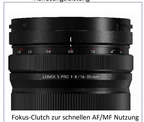
Fokus-Clutch zur schnellen AF/MF Nutzung