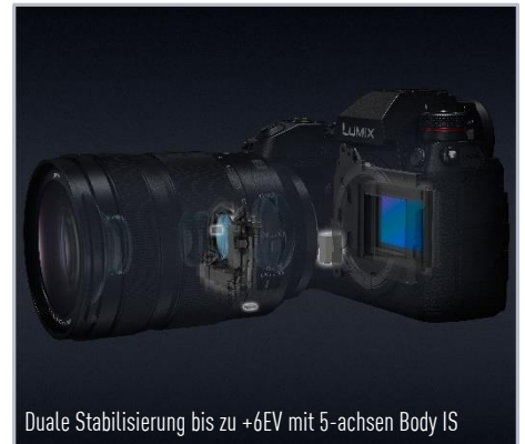
Duale Stabilisierung bis zu +6EV mit 5-achsen Body IS