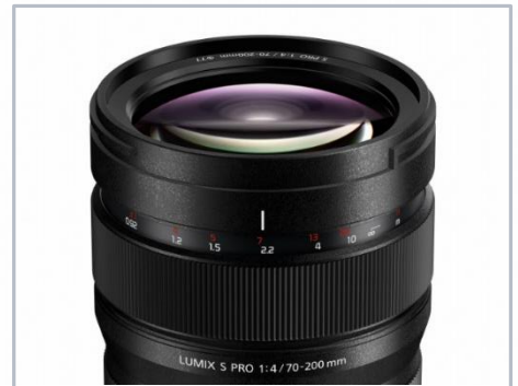
Fokus-Clutch zur schnellen AF/MF Nutzung