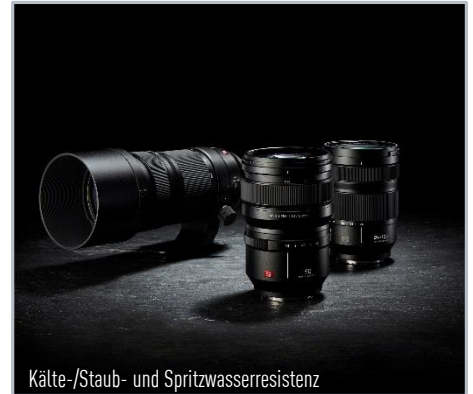
Kälte-/Staub- und Spritzwasserresistenz

LUMIX S Pro Referenzobjektiv – höchste Auflösung bis an den Rand Lichtstärke F1,4 bei 50mm – hohe Freistellung und perfektes Bokeh Robustheit – Staub-, Spritzwasser- und Kälteresistent Schneller & präziser Autofokus - Doppeltes Fokussystem (Linear- und Schrittmotor), 480 Hz Ansteuerung Intuitive Bedienung - Blendenring & Fokus-Clutch Hochwertige Konstruktion - 13 Linsenelemente in 11 Gruppen, 3 asph., 2 ED