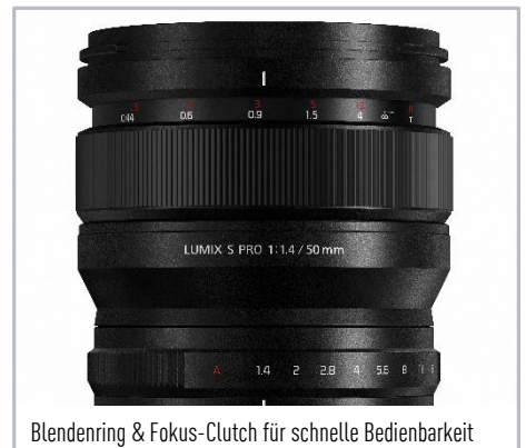
Blendenring & Fokus-Clutch für schnelle Bedienbarkeit