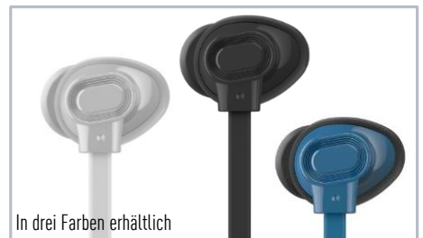
In drei Farben erhältlich

Die In-Ear-Kopfhörer TCM130 sitzen dank ihres ergonomischen Gehäuses fest und komfortabel im Ohr. Sie verrutschen nicht, schirmen durch den perfekten Sitz Außengeräusche ab und ermöglichen so ein noch intensiveres Musikerlebnis. Wird der TCM130 an ein Smartphone angeschlossen (mit 3,5mm Anschluss), können über den Controller im Kabel (mit Ein-Tasten-Bedienung) bequem Telefonate angenommen, beendet oder die Musikwiedergabe gesteuert werden, ohne dass das mobile Endgerät in die Hand genommen werden muss.