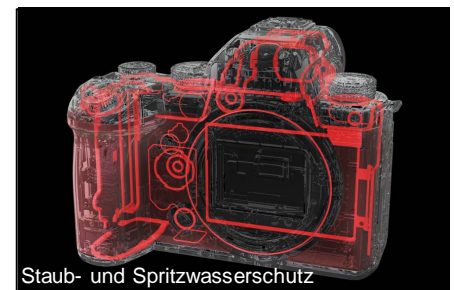
Staub- und Spritzwasserschutz

Mit ihren herausragenden Leistungen im Foto- und Videobereich und einem erstaunlich kompakten und robusten Gehäuse erfüllt die LUMIX DC-S5M2 die hohen Anforderungen von kreativen Foto- und Video-Enthusiasten und bietet gleichzeitig ein außergewöhnliches Preis-Leistungs-Verhältnis.