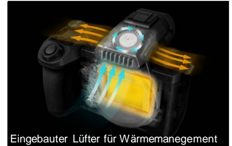
Eingebauter Lüfter für Wärmemanagement

* Body IS und Objektiv IS (sofern im Obj. vorhanden)