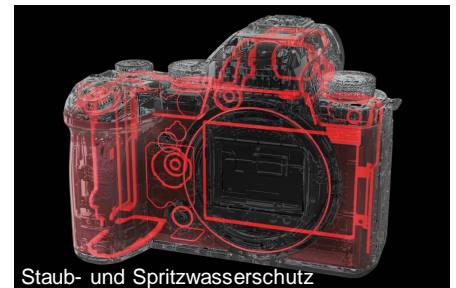
Staub- und Spritzwasserschutz