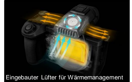
Eingebauter Lüfter für Wärmemanagement

* Body IS und Objektiv IS (sofern im Obj. vorhanden)